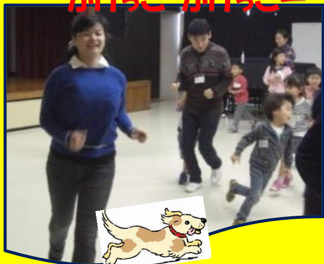
かけっこ かけっこ