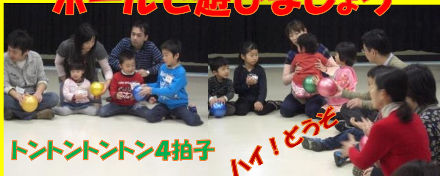
トントントン4拍子